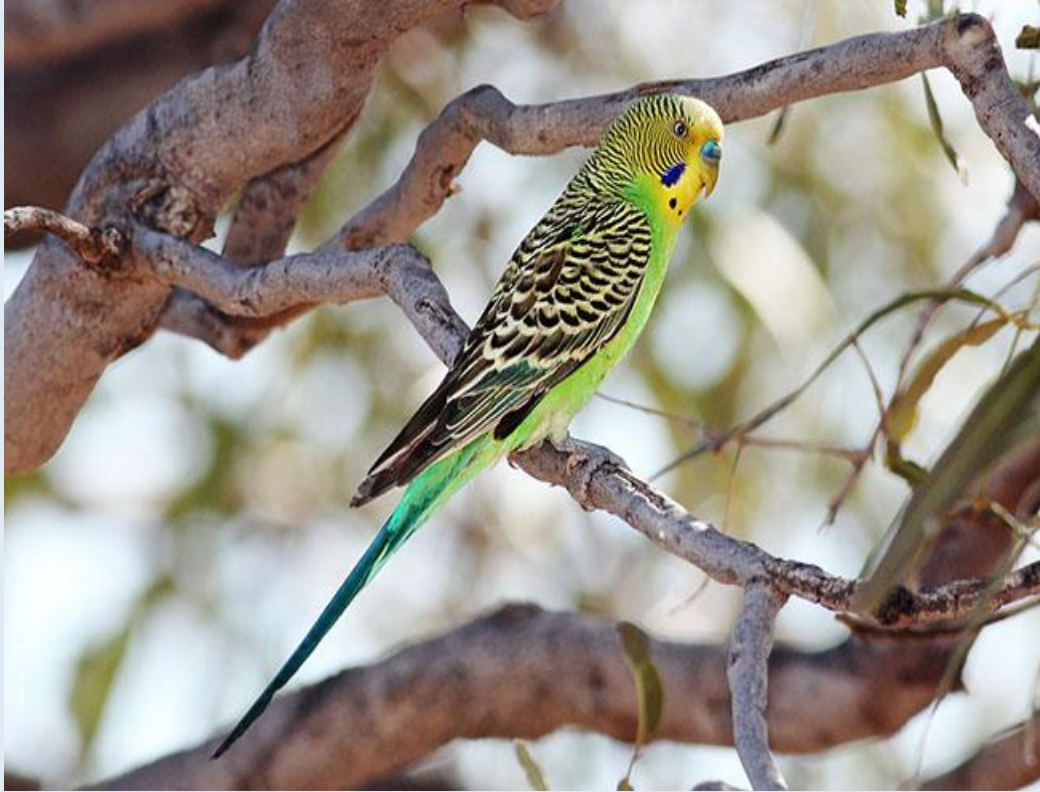
Budgerigar có kích thước nhỏ hơn đáng kể so với nhiều loài vẹt khác