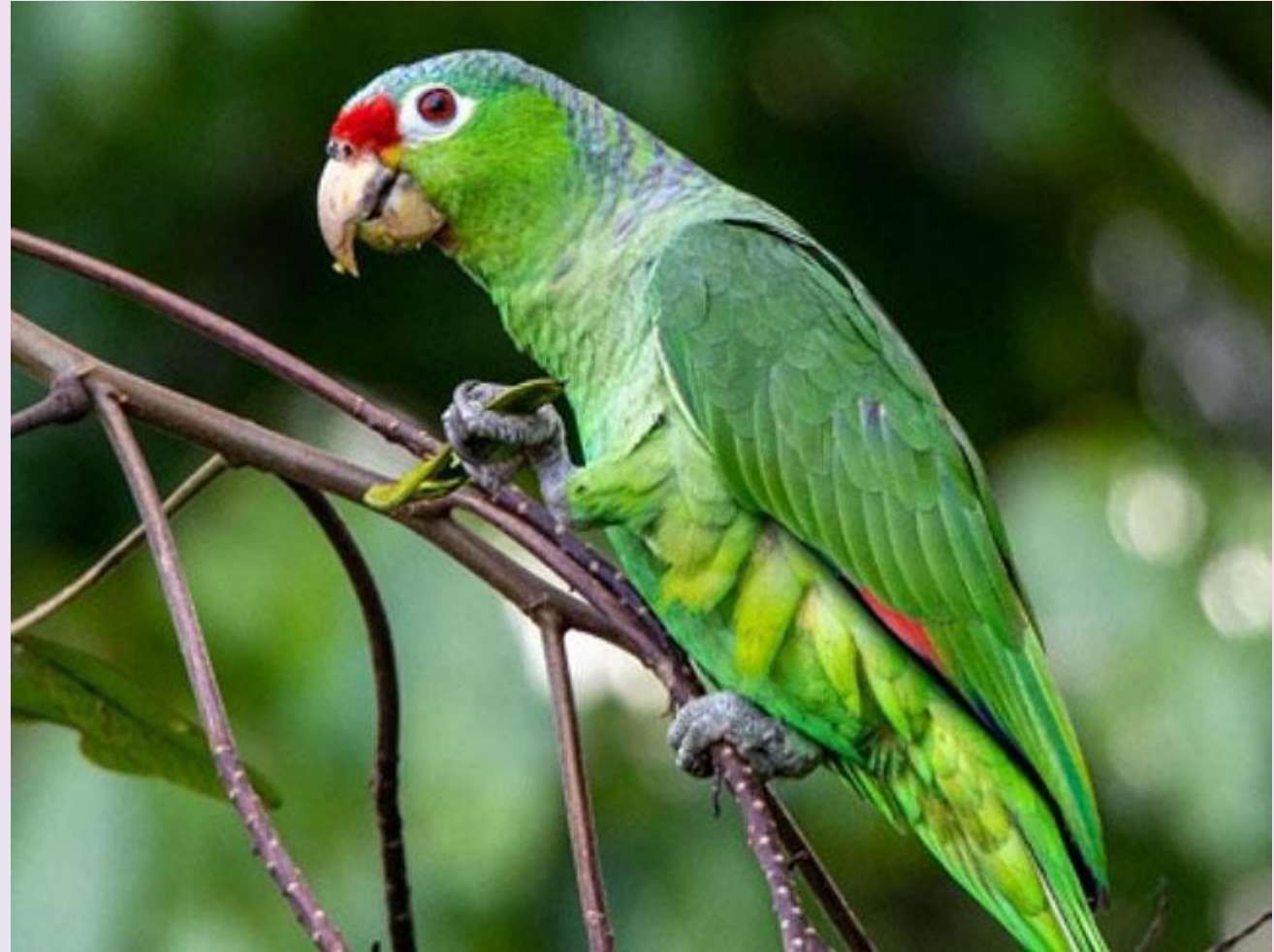
Hầu hết các loài vẹt xanh Amazon thường có màu xanh lá cây là chủ đạo